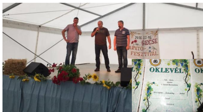
Gecsei Hegybarát Hagyományőrző Egyesület Vezetősége

Június 16-án a Gecse Községért Közalapítvánnyal együttműködve "HEGYI BORONGOLÓ"-t hirdettünk, melyre a gazdák a rossz idő ellenére is szép számmal készültek. Ezen a napon hegyünkön megrendeztük első bormustránkat, ahol meglepően sok bormintát bírálhattunk el. A borbírák elégedetten és kellemes meglepetésekkel zárták a rendezvényt, ahol sok érmes oklevelet és jó szót osztottak ki. Ezúton szeretnénk köszönetet mondani minden tagunknak és támogatóknak az eddig elért munkáért és sikerekért!